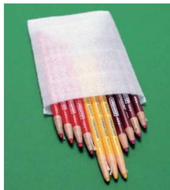
Folienstärke in 1, 1.5, 2, 3, 4 oder 5 mm lieferbar, umwelt-schonend, recyclingfähig.