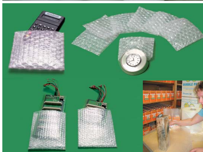
Zuschnitte und Beutel nach Ihren Angaben. Lieferung ab 1.000 Stück.