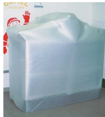
Schutz aller empfindlichen Gegenstände.