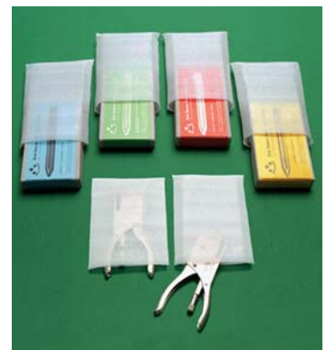
Taschen, Beutel oder Schläuche werden ab 1000 Stück nach Ihren Angaben gefertigt.