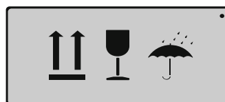
(waagrecht / horizontal)

Es sind auch mehrere Warnzeichen innerhalb einer Schablone möglich: