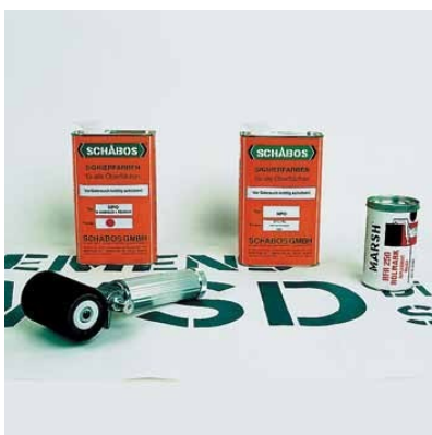
Grundausstattung mit MARSH Füllroller