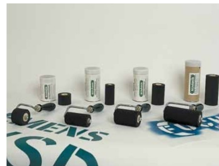
Verschiedene Rollenausführungen lieferbar