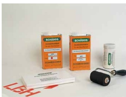
Grundausrüstung mit Handroller 8 cm