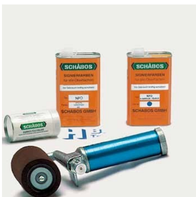
Grundausstattung Füllroller 8 cm Breite

Markierung auf allen glatten oder porösen Oberflächen: Metalle, Kunststoffe, Folien, Papier, Holz, Säcke usw.