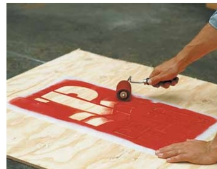
Signierung mit SCHABOS Handroller