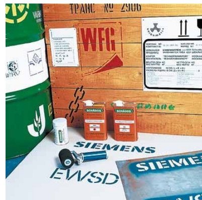
Saubere Signierung mit dem Füllroller