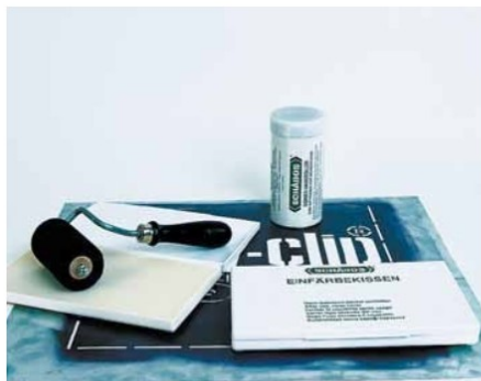
Handroller und Einfärbekissen

Nach längeren Arbeitspausen nur einige Spritzer NPO Verdünner auf Rolle und Kissen geben oder neue Farbe auf das Einfärbekissen gießen. Nur NPO Verdünner verwenden, da sonst Rolle und Kissen aufquellen und unbrauchbar werden.