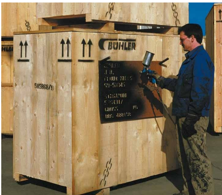
Signierung der Exportverpackung mit Spritzpistole.

Wir empfehlen jedoch aus Sicherheitsgründen mit Atemschutz und Schutzbrille zu arbeiten.