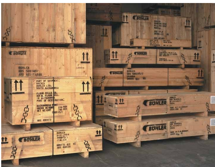
Mit Spritzfarbe fertig markierte Kisten vor dem Abtransport.