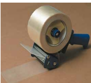
SCHABOS Handabroller T 530 für 75 mm Filamentband

ist ein faserverstärktes Kunststoff-Klebeband, das zum vorschriftsmäßigen Verschließen von Gefahrgut-Kartons in 75 mm Breite benötigt wird. Gitterband wird bei der Ausführung 4 GV eingesetzt.