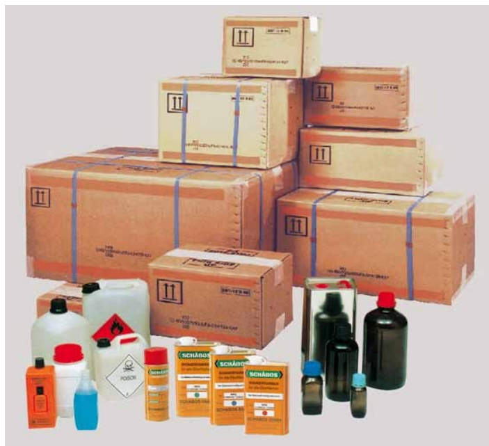
UN-zugelassene Verpackungen für „Gefährliche Güter“

Typ III (Z) = Stoffe geringer Gefährlichkeit