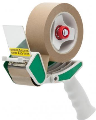
Handabroller T260 BSP für 50 mm Bandbreite.

Best.-Nr. 46 35 03 Typ T251 46 35 07 Typ T252