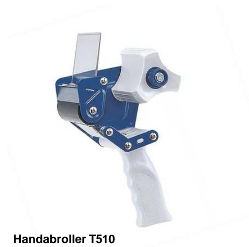
Handabroller T510 für 75 mm Bandbreite.

Besonder stabiler und robuster Komfort-Bandabroller mit Metallrahmen für bis zu 75 mm breite Klebebänder aller Art.