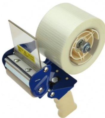
Handabroller T530 für 75 mm Bandbreite.

Leichter und kompakter Bandabroller für bis zu 75 mm breite Klebebänder mit verstellbarer Bremse für den Abrollwiderstand.