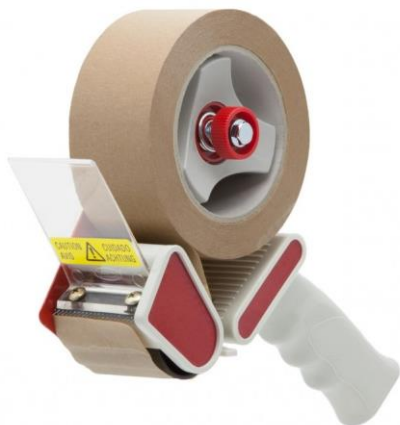
Handabroller T270 für 50 mm Bandbreite.

Hand-Abrollgeräte für alle selbstklebenden Bänder