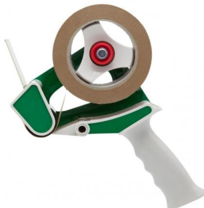
Handabroller T260 für 50 mm Bandbreite.

Leichter und komfortabler Bandabroller für bis zu 50 mm breite Klebebänder aller Art. Auch für Sparrollen mit 180 lfm geeignet. Das Messer ist auswechselbar.